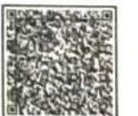
(Archana Badhe - Naware) I/c Registrar